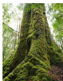
...nagyon mohás fát