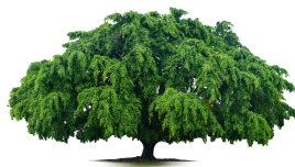
...régi, öreg fát