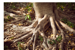
...nagy, látható gyökereket