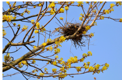
...fészket a fán